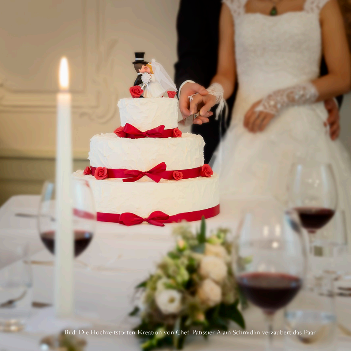
Bild: Die Hochzeitstorten-Kreation von Chef Pâtissier Alain Schmidlin verzaubert das Paar