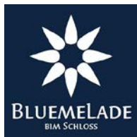
Bild: Blumenstrauss von Bluemelade bim Schloss

Genauso haben sie sich den Rahmen für ihren ganz grossen Tag erträumt – mit viel Herz ist der Raum gestaltet, und diese Leidenschaft spürt man förmlich. Bestimmt werden auch ihre Gäste dies wahrnehmen.