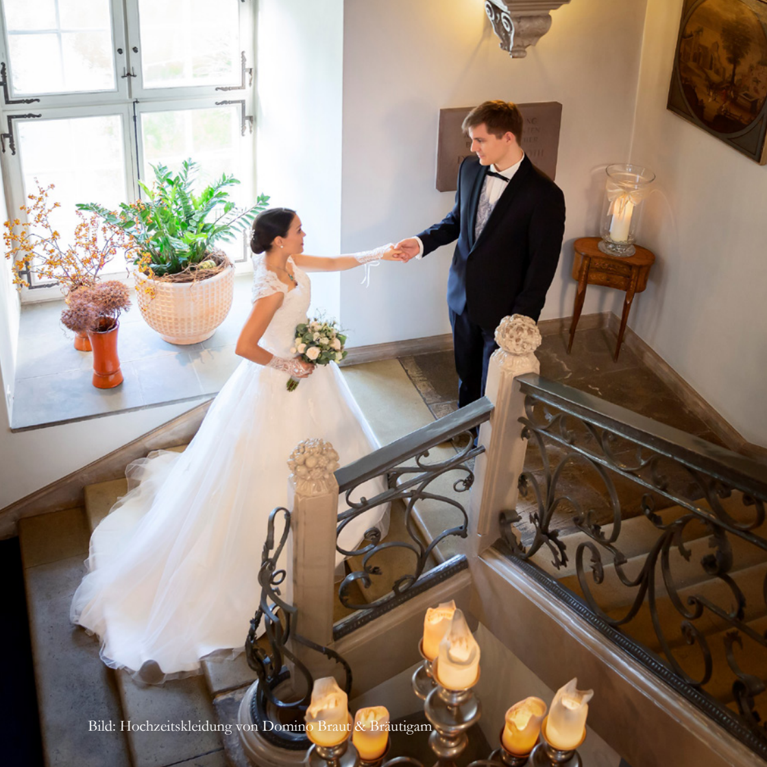
Bild: Hochzeitskleidung von Domino Braut & Bräutigam