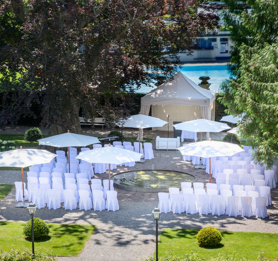
Bild: Faltzelt und Mobilier von Mietzelte Huber